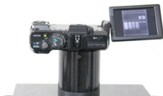
バリアングル液晶モニター